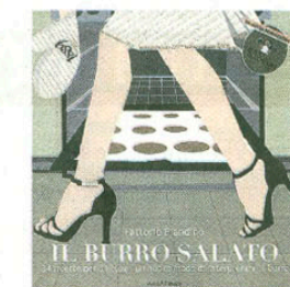
TITOLO: IL BURRO SALATO AUTORE: FATTORIE FIANDINO EDITORE: ARABAFENICE